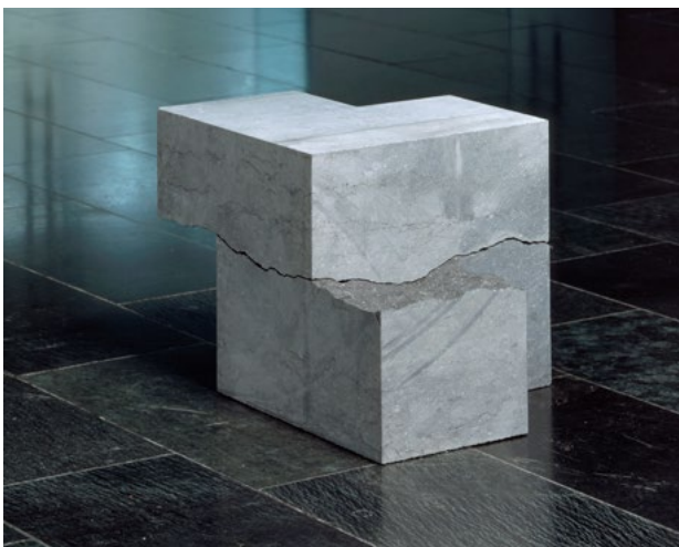
Mental Rotation 12, Belgisch Granit 52,5 x 38 x 35 cm, 2011