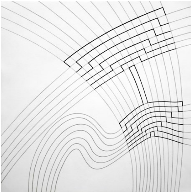
Eine Bildsequenz (Welle), Bleistift auf Papier, 40 x 40 cm, 2015

Krasimira Stikar , 1980 in Bulgarien geboren, absolvierte 2005 ihr Studium bei Peter Kogler an der Akademie der bildenden Künste Wien.