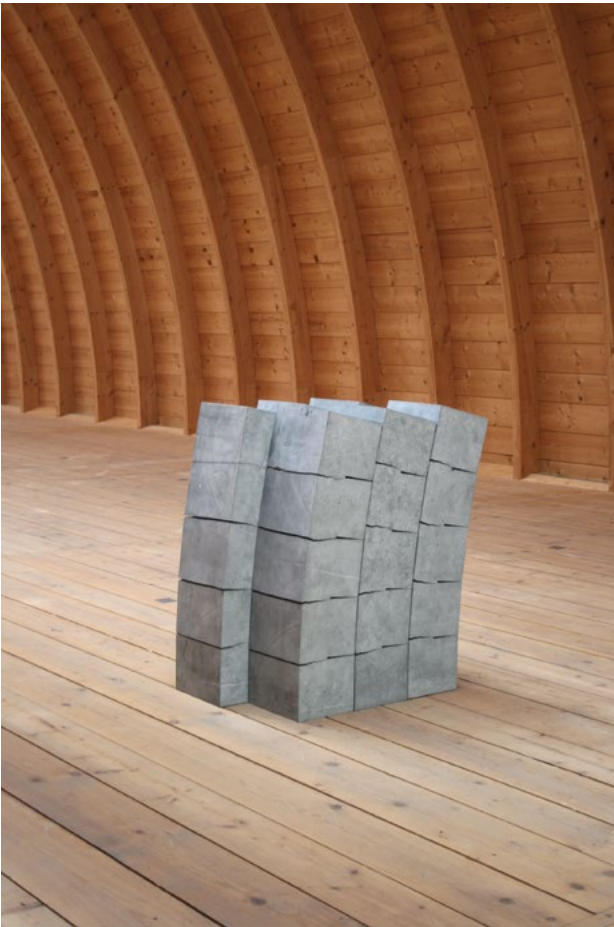
Konstellation 30-7, Belgisch Granit, 105 x 105 x 70 cm, 2006 – 20