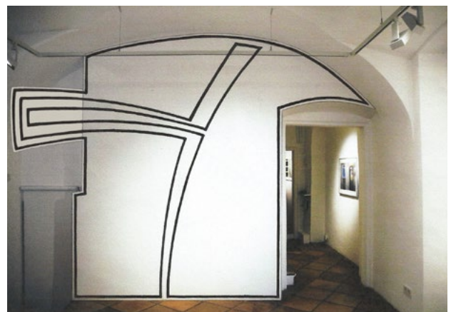
Bewegung und Stillstand, Wandmalerei (Entwurf) Galerie Straihammer und Seidenschwann, 2017