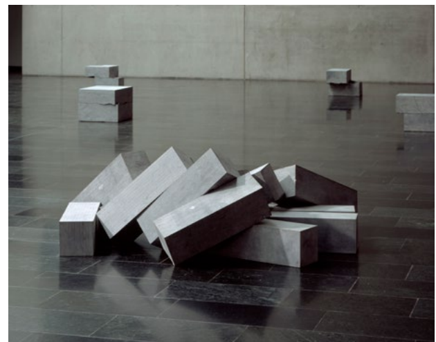
Konstellation 12 II, Belgisch Granit Modulgröße: 68 x 20 x 20 cm, 2006 – 2017